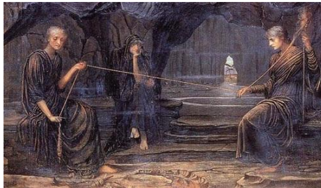
Nerunt fātālēs fortia fīla deae