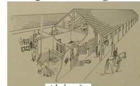
stabulum, ī, n.