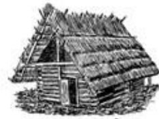
casa, -ae, f.