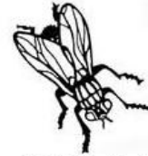
musca, -ae, f.